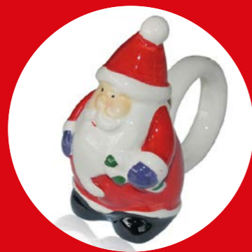
Abbildung ähnlich. Nur ein Coupon pro Person und solange der Vorrat reicht. Gültig vom 01.12.2018 bis 31.12.2018.

Gegen Vorlage dieses Gutscheins erhalten Sie einen Nikolaus- Serviettenring gratis!